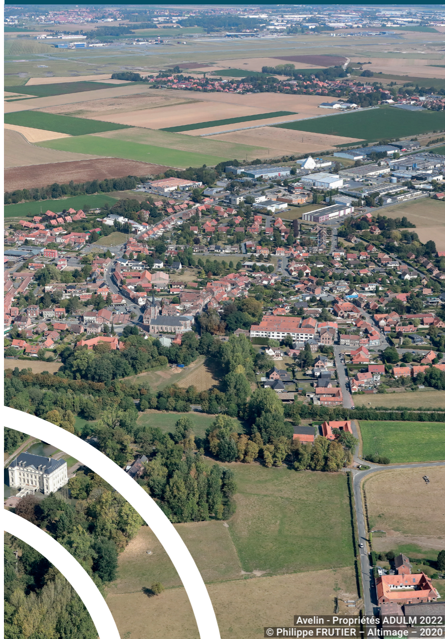
Avelin - Propriétés ADULM 2022

L'élaboration de notre premier PLUi est un outil clé pour agir sur l'ensemble des dimensions du projet de territoire, car il souligne aussi la nécessité de cohésion entre les communes. Les ateliers de concertation mis en place avec l'ADULM, tout au long de l'année 2023, sur l'ensemble du territoire, ont participé à cet objectif, en invitant les élus locaux et les habitants à partager leurs idées pour l'avenir de la Pévèle Carembault. C'est un travail constructif !