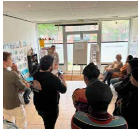
Atelier-débat sur la transition écologique et solidaire avec les habitants animé par l'ADULM au sein de l'associations Iris Formation – Quartier de Wazemmes à Lille

Les indicateurs actuels montrent que 91% des habitants des QPV résident dans des Iris 1 vulnérables, dont 60% dans des zones qualifiées de « fragiles », soit près du double de la moyenne métropolitaine (34%). Ces quartiers se distinguent par des infrastructures vieillissantes ou inadéquates, des logements anciens et dégradés, des îlots de chaleur urbains etc.