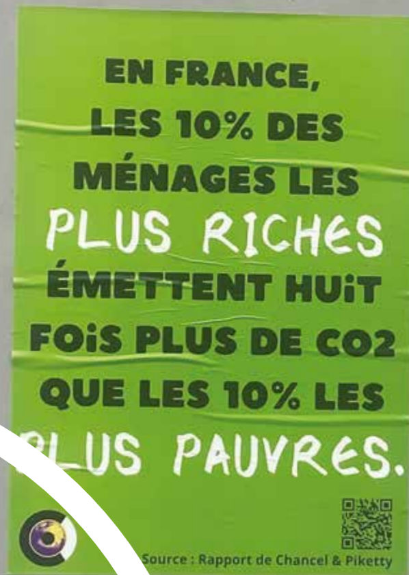
Affiche sur un mur du quartier de Moulins à Lille

Or, les plus pauvres sont généralement exclus des réflexions et les préjugés sont nombreux. Alors qu'au quotidien, ils doivent faire preuve d'adaptation et sont, de façon subie, inventeurs de gestes écologiques, et ont des pratiques frugales. Ils aspirent fortement à ce que leurs enfants aient une vie meilleure. Pour progresser vers une politique environnementale juste, il faut refonder les politiques publiques à partir de l'expérience et de la participation des personnes vivant dans la pauvreté. Mais les conditions de participation, que nous expérimentons à ATD Quart Monde ne sont pas simples et demandent de prendre le temps nécessaire. L'étude réalisée par l'ADULM apporte des éléments. C'est avec toutes et tous, qu'il faut écrire un nouveau récit d'une société qui se construit, à l'échelle des bassins de vie, en ayant le souci du bien-être de tous ses habitants.