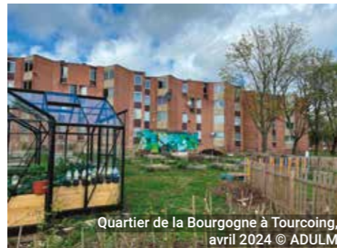
Quartier de la Bourgogne à Tourcoing, avril 2024

Certains rejettent l'écologie, perçue comme un concept élitiste ou inaccessible. Cette relation ambivalente s'explique par des barrières psychologiques et matérielles (fatigue, manque de moyens) ainsi qu'un manque d'information. Les habitants jugent souvent leurs actions insuffisantes, bien qu'ils s'investissent déjà dans des pratiques durables.